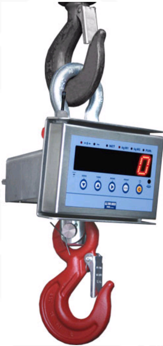
MCWK: Kraanwaage aus Edelstahl IP67.

Die Edelstahl Kranwaage hat ein großes 40mm LED- (Punkte) - Display. Aus jedem Winkel und bei schlechten Lichtbedingungen selbst bei direktem Sonnenlicht ist die Waage gut sichtbar. Robust und zuverlässig einsetzbar bei jeder beliebigen Innen- oder Außenumgebung. IP67 Schutzgehäuse, geeignet bei starker Verschmutzung und Regen. Erhältlich mit CE-M Zulassung. Ausgestattet mit einem Testzertifikat, das mit Prüfgewichten durchgeführt wurde.