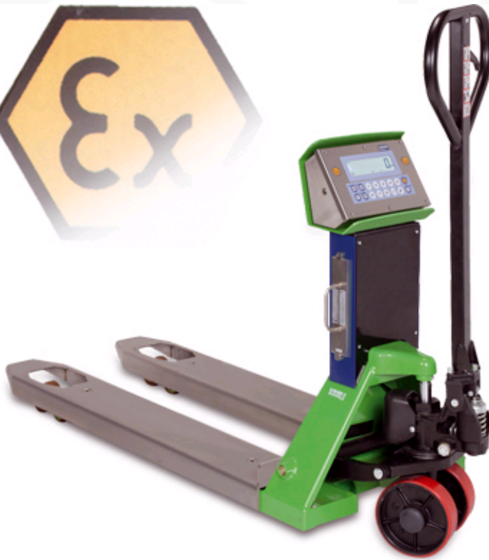
TPWX mit optionalen EDELSTAHL GABELN.