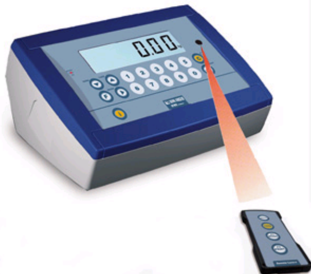
DFWK06XPCC mit Fernbedienung (Optional)